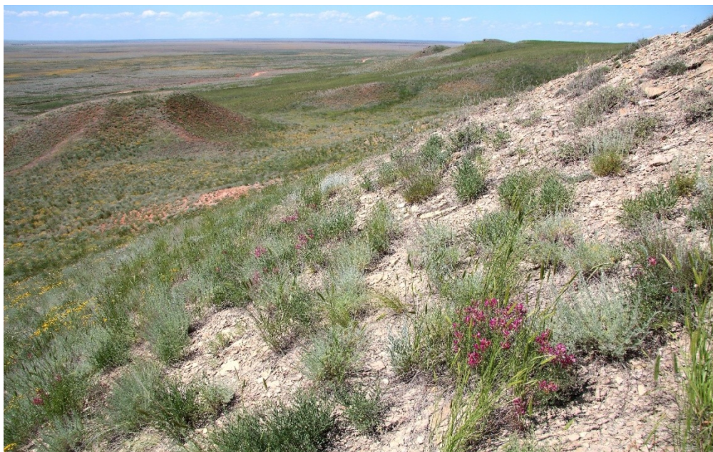
Рис. 3. Популяция эверсмании слегка-колючей на южном склоне г. Большое Богдо

Это уникальное явление, показывающее большую приуроченность растительных сообществ с участием эверсмании к абразивным берегам Хвалынского моря. Везде эверсмания предпочитает карбонатные известняки и мергели, часто произрастает на осыпях, укрепляя их хорошо развитой корневой системой.