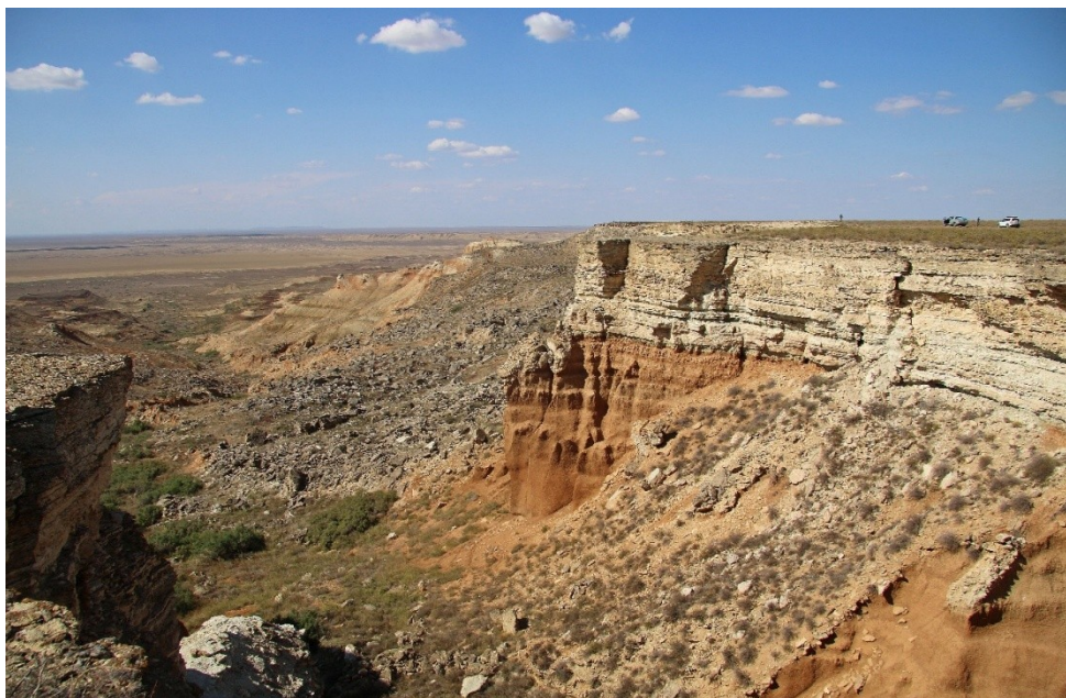
Рис. 2. Склоны обрывов (чинков) Северного Устья являются местообитаниями эверсмании слегка-колючей и её «флористической свиты» на бывшем восточном берегу Хвалынского моря

моря). Эти сообщества тянутся вдоль бывшей береговой линии как на г. Б. Богдо, так и на склонах (чинках) возвышенностей Северного Устья (рис. 2, 3).